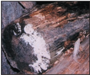
Moho creciendo sobre leña al exterior. Los mohos tienen varios colores, esta foto enseña ambos mohos blanco y negro.

Los mohos forman parte del medio ambiente natural. Al exterior, los mohos juegan un papel en la naturaleza al desintegrar materias orgánicas tales como las hojas que se han caído o los árboles muertos. No obstante, al interior, es necesario evitar el moho. Los mohos se reproducen mediante esporas; las esporas son invisibles a simple vista y flotan en el aire exterior e interior. Las esporas de mohos se hallan normalmente presentes en el aire exterior e interior. El moho puede crecer al interior cuando las esporas